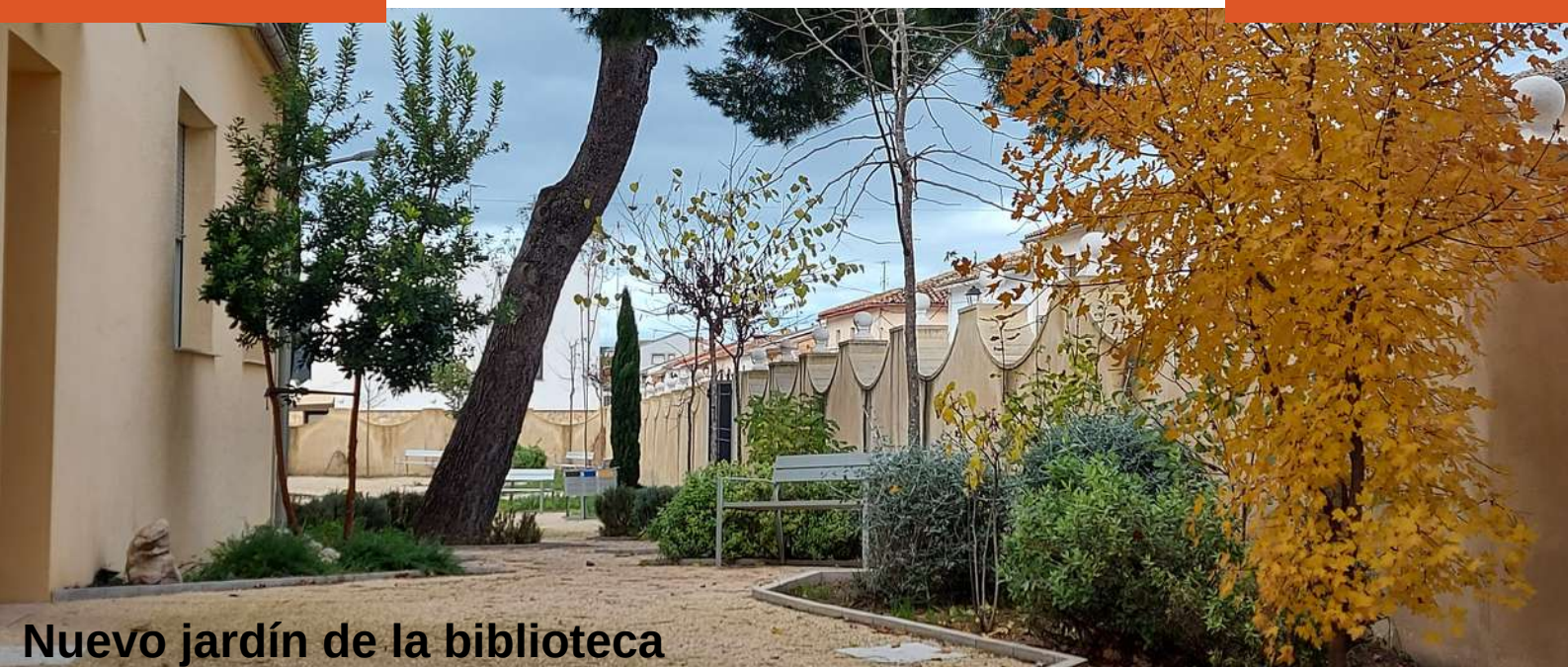
Nuevo jardín de la biblioteca